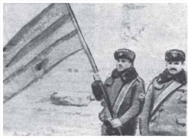
БАНДФОРМИРОВАНИЕ ПОД НАЗВАНИЕМ «ГВАРДИЯ»