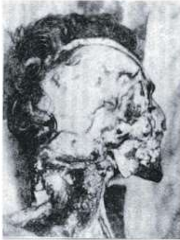
Ингуш из поселка Южный