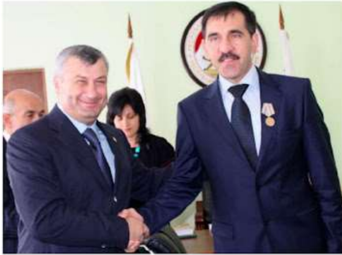
Глава Ингушетии Ю-Б. Евкуров вручил первому президенту Ингушетии Р. Аушеву высшую награду республики - орден «За заслуги»